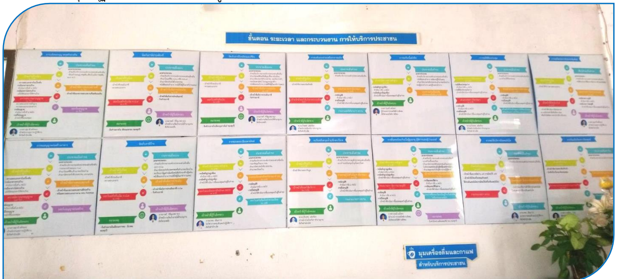
ผังแสดง ขั้นตอน และระยะเวลาการปฏิบัติงาน